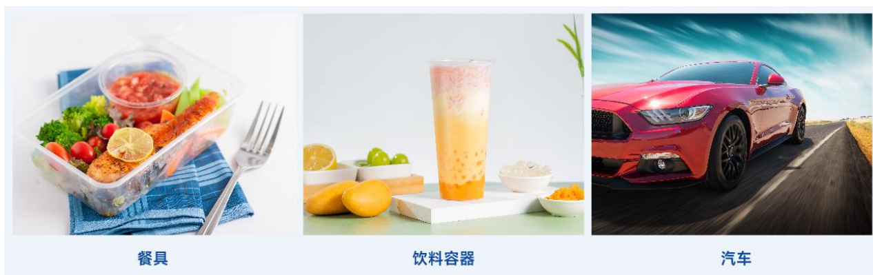
图：PP 专用料应用场景

PP 专用料为合成树脂的重要品类，具有耐热耐腐蚀、高强抗冲、透明性好、易加工等多方面的优异性能，PP 专用料在一次性用品、耐用品应用领域均具有稳定的成长空间。国内 PP 产品结构升级及产品高端化、专用化是大势所趋，高端 PP 产品将成为行业主要增长动力。“互联网+”时代，受益于快递、餐饮外卖等产业持续发展，以及材料轻量化、医疗条件升级、传统家电行业转型升级等因素综合作用，薄壁注塑料、汽车轻量化专用料、透明料、管材料、高熔体强度料等具有独特性能的高端 PP 产品需求稳定增长。据摩根大通预测，2025 年中国食品外卖配送量增速约 13%，带动食品包装用 PP 薄壁注塑专用料需求同步增长；据中商产业研究院预测，2025 年中式新茶饮赛道规模突破 2,000 亿元，年复合增长率达 15%，推动了 PP 高熔无规共聚专用料需求的增长。据卓创资讯统计，2025 年 1-6 月，国内市场 PP 薄壁注塑专用料和 PP 高熔无规共聚专用料产量合计约 117 万吨，同比增长 14%。