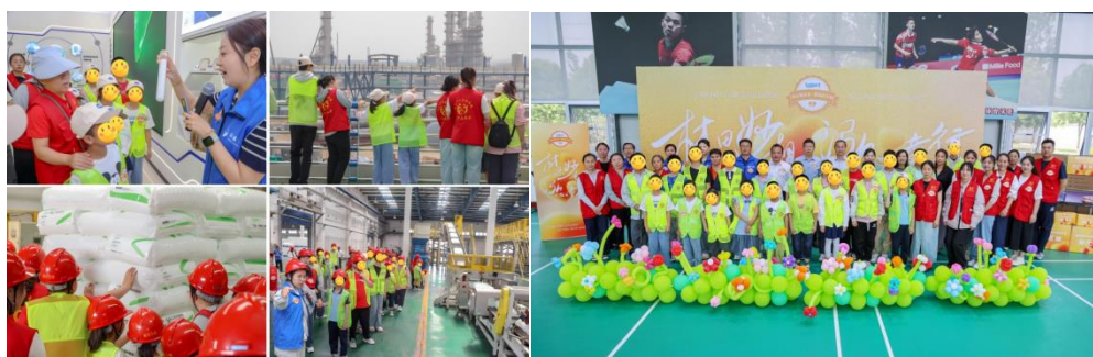
图：公司关爱枣庄市儿童福利院儿童活动

公司本着“一般困难机制帮、突发困难及时帮、突出困难重点帮”的帮扶原则，通过内部公益组织“泓基金”，自 2019 年以来，公司已连续 6 年组织员工志愿者团队每季度到枣庄市儿童福利院开展爱心慰问志愿活动，积极帮助福利院孤残儿童，捐赠爱心物资。报告期内，公司携手枣庄儿童福利院开启“材思妙想，泓心童行”公益研学之旅，福利院儿童走进公司滕州总部基地进行参观，公司捐赠爱心物资。