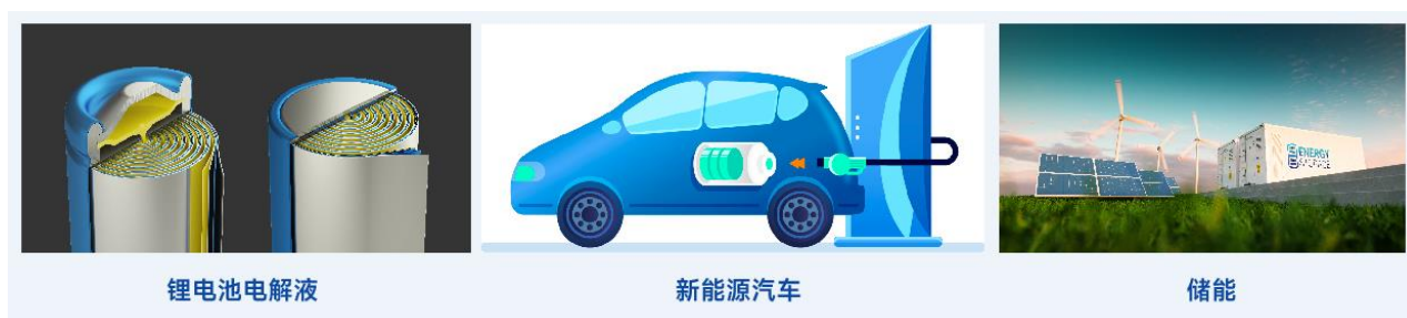
图：电解液溶剂及添加剂应用场景