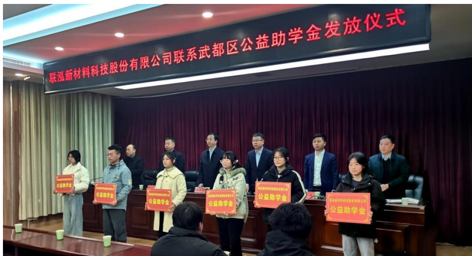
图：公益助学金发放仪式

报告期内，公司积极响应全国工商联“万企兴万村”行动号召，支持乡村振兴建设，对接国家乡村振兴重点帮扶县——甘肃省陇南市武都区，为当地扶贫助农工作贡献力量，向武都区捐赠了 30 万元公益助学金，用于帮助该地区困难大学生。