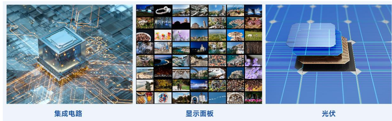
图：电子特气应用场景

规模约为 250 亿元。2025 年上半年，AI 大模型的快速发展，以及消费电子行业复苏，推动算力、存储芯片的需求进一步增加，促进国内电子特气需求的快速增长。在国家鼓励关键战略材料供应链自主可控和市场需求的驱动下，电子特气产业未来增长趋势明确，发展空间大。