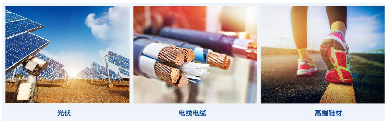
图：EVA 高端料应用场景

EVA 是光伏胶膜的主要材料，具有高透光率和良好的交联度，加工性能突出，应用基础广泛。此外，EVA 下游还包括鞋材玩具、电线电缆、热熔胶、涂覆、农膜等。根据卓创资讯统计，2025 年 1-6 月，国内 EVA 装置运行良好，产量为 140.1 万吨，表观消费量为 164.2 万吨，进口依存度为 23.2%。未来五年，光伏及其他下游应用领域需求将保持较快增长，预计 EVA 需求复合增长率可达 11.2%，至 2029 年 EVA 总需求量将达到 535 万吨。